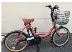
使用車両 ヤマハ PAS CITY-C 満充電状態で、 約50kmアシスト可能